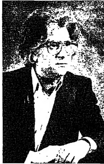
الرسم زهرا روحانية الايمان